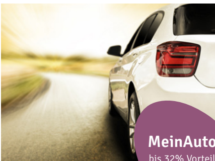
MeinAuto bis 32% Vorteil

Exklusive Einkaufsvorteile bei mehr als 400 Partnerunternehmen garantieren Vielfalt: