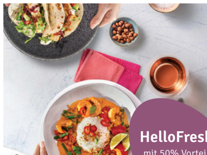
HelloFresh mit 50% Vorteil