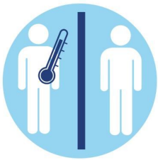
Separate Bereiche für Infektionspatienten