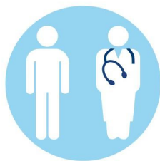
Nutzung ambulanter Behandlungsmöglichkeiten

Sicherheit hat im Krankenhaus gerade jetzt in Zeiten der Corona Pandemie eine besonders hohe Bedeutung.