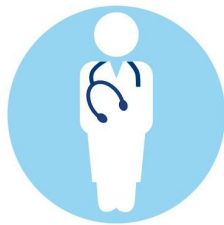
Speziell geschultes Personal