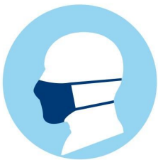
Maskenpflicht und Besuchsregeln