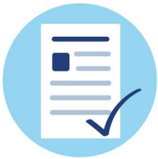
Corona-Tests als Standard für jeden Patienten