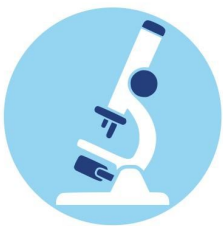
Stiftungseigenes Kompetenzzentrum Mikrobiologie & Hygiene